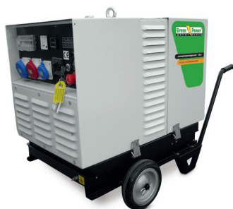
CARRELLO MANUALE TROLLEY