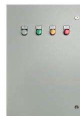
QUADRO DI COMMUTAZIONE AUTOMATIC TRANSFER SWITCH