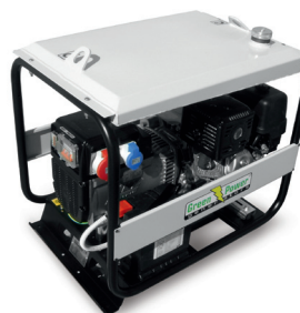
SERBATOIO MAGGIORATO OVERSIZED FUEL TANK