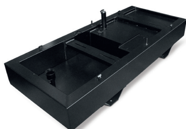
VASCA DI RACCOLTA LIQUIDI BOUNDED TANK