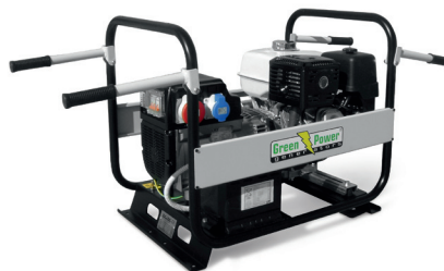
KIT BARELLABILE HANDLES KIT