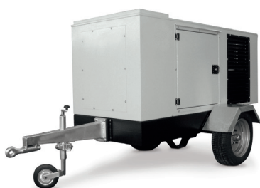
CARRELLO TRAINO LENTO SLOW SPEED TRAILER