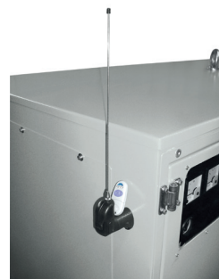
RADIO COMANDO RADIO REMOTE CONTROL