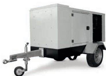
CARRELLO TRAINO LENTO SLOW SPEED TRAILER