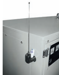
RADIO COMANDO RADIO REMOTE CONTROL