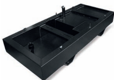
VASCA DI RACCOLTA LIQUIDI BOUNDED TANK