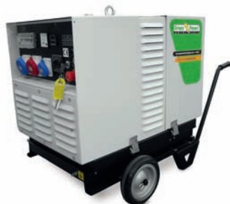
CARRELLO MANUALE TROLLEY