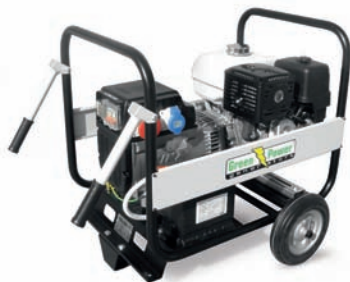
KIT CARRELLO TROLLEY KIT