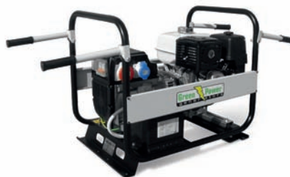
KIT BARELLABILE HANDLES KIT