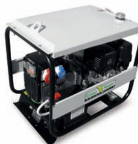
SERBATOIO MAGGIORATO OVERSIZED FUEL TANK