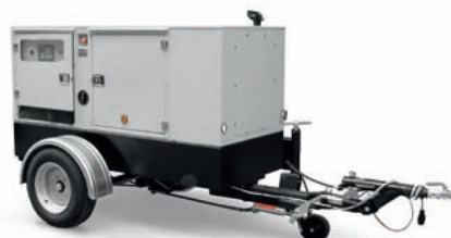
CARRELLO STRADALE ROAD TOW TRAILER